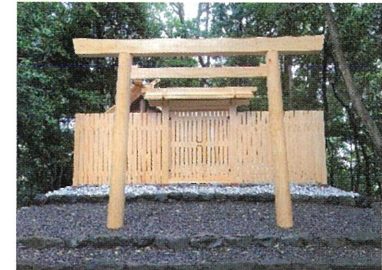
24. 田上大水神社(丸山さん)