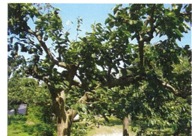
26. 蓮台寺柿(伊勢市天然記念物)